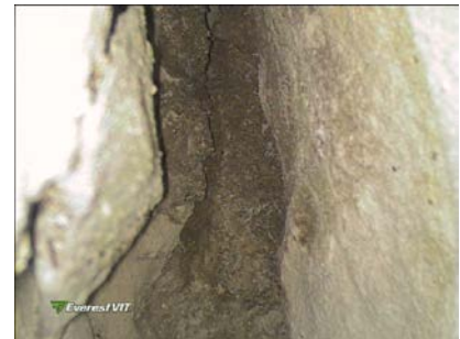
Immagini delle principali analisi di termografia, scansione radar e videoendoscopia