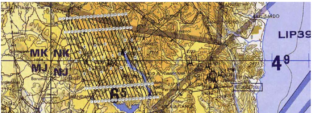
Pianificazione del volo sul sito di Isili

L'attività di telerilevamento aereo nella Regione Sardegna è stata incentrata sulla discretizzazione delle piantagioni illecite di cannabis. Le attività svolte fino ad ora hanno riguardato la pianificazione e la realizzazione dei voli in riferimento ai siti segnalati dalla Guardia di Finanza. I dati saranno, quindi, processati ed analizzati secondo le procedure del Protocollo tecnico-scientifico di telerilevamento iperspettrale, termico e fotografico.