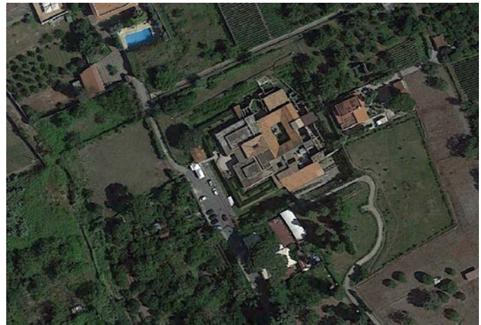
Villa dei Misteri: planimetria e ripresa satellitare da Google Earth