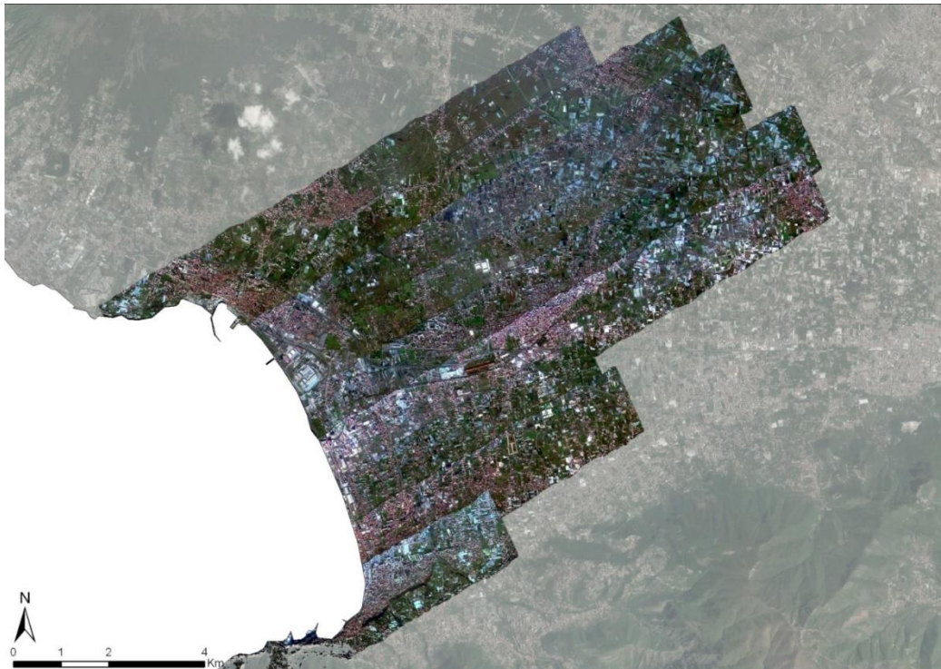
Mosaicatura dei dati telerilevati in data 12 dicembre 2015 con i sensori di Benecon S.C.Ar.L. su velivolo del GEA della Guardia di Finanza. Area SUD

I fotogrammi ad altissima risoluzione hanno fornite un'ulteriore prova delle anomalie riscontrate mediante l'elaborazione dei dati iperspettrali.