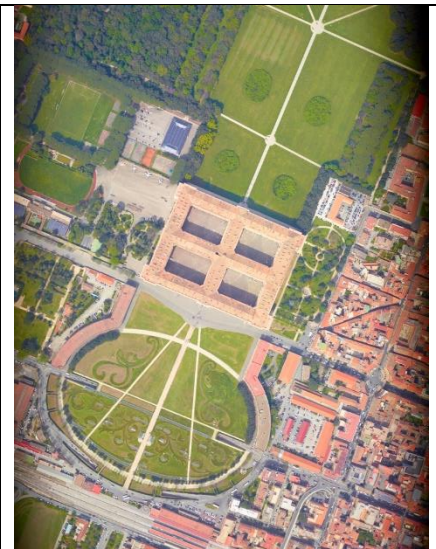
Reggia di Carditello e Reggia di Caserta, Fotogrammi ad altissima risoluzione