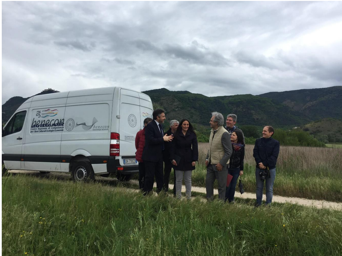
Il Team Benecon e gli ufficiali della Guardia di Finanza del Gruppo di Cassino

L'attività ha previsto un sopralluogo sulle aree oggetto di interesse.